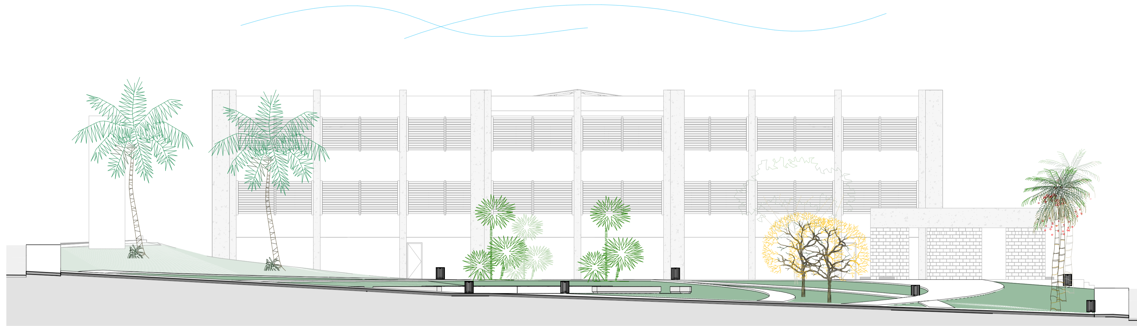
CORTE CC Escala 1 : 125